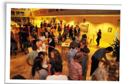
Afrika-Tag am Gymnasium Beilngries mit Leckereien der südafrikanischen Küche, vorbereitet von Mitgliedern der Vezuthando-Gruppe Beilngries