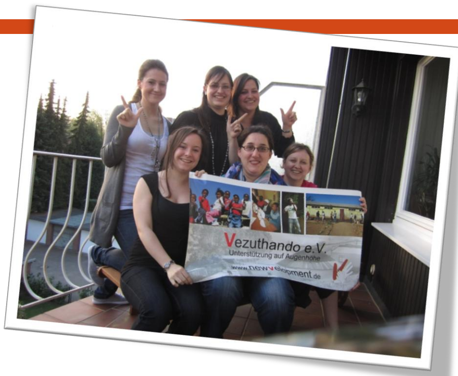
Die Vezuthando-Gruppe Niederrhein hat sich 2011 gegründet und seitdem zahlreiche Events organisiert.

Auch der Spaß und der Gestaltungsspielraum der selbstständig arbeitenden Gruppen halten die Mitglieder zusammen. Der Vezuthando Vorstand und Fachausschuss sowie weitere Mitarbeiter sind Ansprechpartner hinsichtlich Koordination und Öffentlichkeitsarbeit und geben gerne bei Fragen Hilfestellung. Welche Aktivitäten, wie und wo stattfinden, entscheidet die