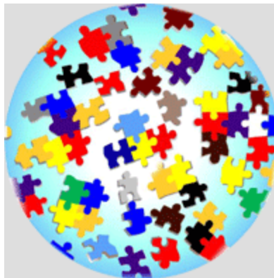
Logo der „Interkulturellen Wochen Leipzig“